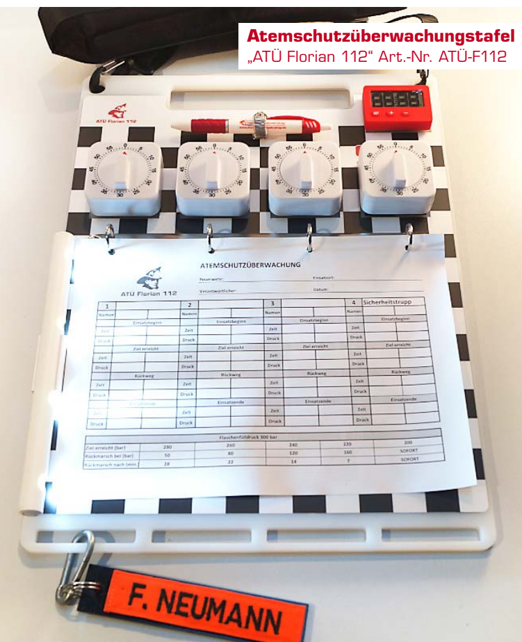
Atemschutzüberwachungstafel „ATÜ Florian 112“ Art.-Nr. ATÜ-F112